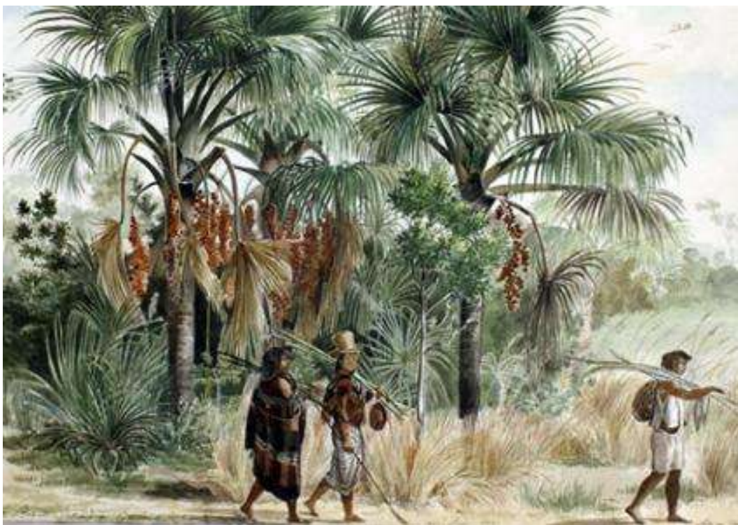
Palmiers appelés Boriti, dessinés ao Quilombo, district de Chapada. Taunay, Adrien, 1827

Embora Aimé-Adrien Taunay, tenha registrado inúmeros vegetais isolados e feito isto com maestria, uma de suas mais belas e representativas obras é “Palmiers appelés Boriti, dessinés ao Quilombo, district de Chapada” , de 1827, em que mostra as lindas e vigorosas palmeiras em seu habitat natural, enfatizando-as por meio de cores mais intensas e reais. Os arredores e o fundo foram suavizados, de maneira a destacar o conjunto principal da obra. Os índios guaianás que passam em primeiro plano evidenciam a proporção das árvores, e a maneira com que se vestem e o que transportam revelam costumes da época, enriquecendo sua obra com preciosas informações.